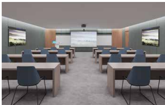
CLASS ROOM 4 Stem Walls | 1 Stem Hub | 1 Stem Control