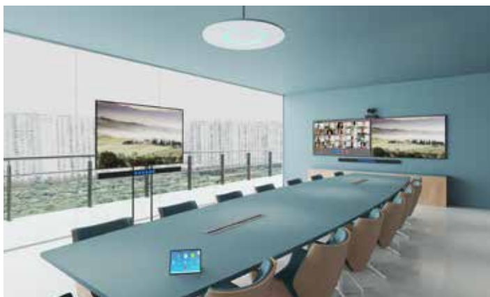
LARGE CONFERENCE ROOM 2 Stem Walls | 1 Stem Ceiling | 1 Stem Hub | 1 Stem Control