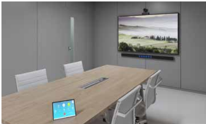
HUDDLE ROOM 1 Stem Wall | 1 Stem Control

아래의 레퍼런스 디자인은 다양한 회의실 환경에 요구사항을 충족하는 Stem Ecosystem 디바이스의 다양한 조합을 보여주는 몇 가지 예시입니다.