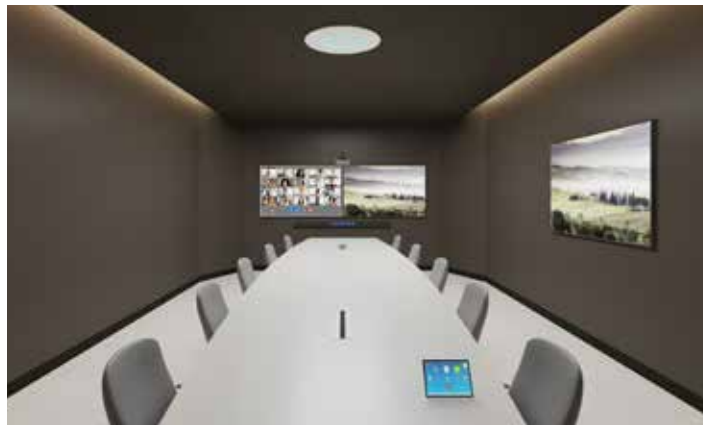
MEDIUM CONFERENCE ROOM 1 Stem Ceiling | 1 Stem Wall | 1 Stem Hub | 1 Stem Control